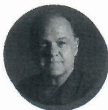
Oscar Schmidt Recordista mundial de pontuação no basquete e palestrante motivacional