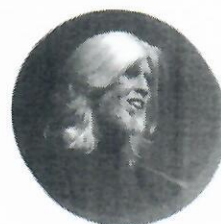
Oswaldo Montenegro Cantor e compositor de músicas que fizeram sucesso em novelas e no cinema