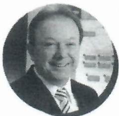
Guerino Balestrassi Prefeito de Colatina pelo terceiro mandato e idealizador do Colatina Conectada