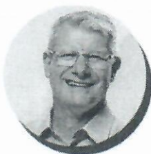
Paulo Foletto Deputado Federal quatro vezes eleito, foi Secretário de Estado e duas vezes Deputado Estadual