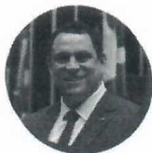
Josias Da Vitória Deputado Federal pelo segundo mandato consecutivo e coordenador da Bancada Federal Capixaba no Congresso pelo quinto ano