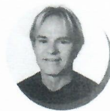
Sérgio Meneguelli Ex-Prefeito de Colatina e Deputado Estadual eleito com a maior votação da história do Espírito Santo