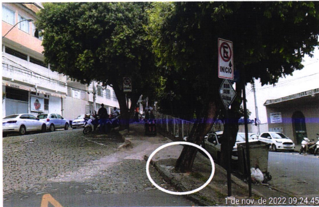
Árvore 01 - Espécie oiti

Autorizado o corte pela SEDUMA - AA 104/2022