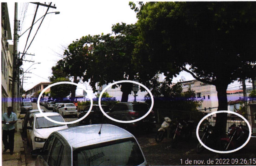
Árvore 05 (Esp. cast. seca) Árv. 04(espécie castanheira) Árv. 03 (Espécie oitizeiro)

Árvores 03 (espécie oitizeiro) , 04 (espécie castanheira sete copas) e 05 (espécie cast. sete copas seca)