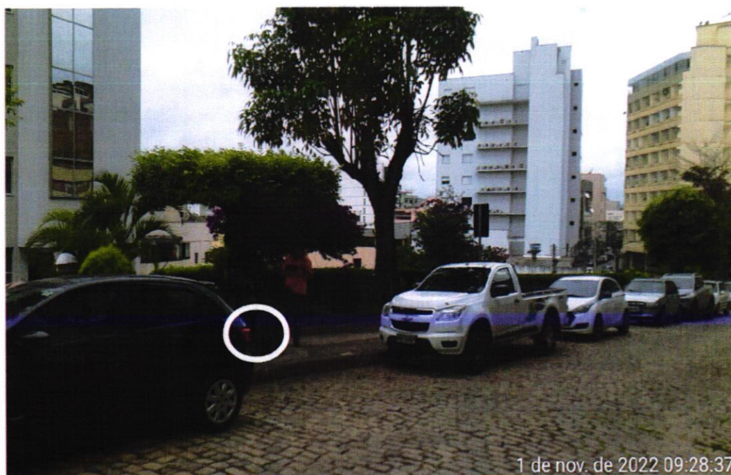
Árvores 08 (Espécie oitizeiro)