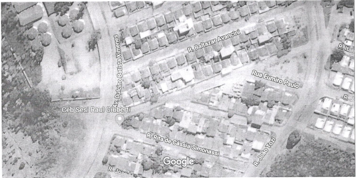
Imagens ©2019 DigitalGlobe, Dados do mapa ©2019 Google 50 m