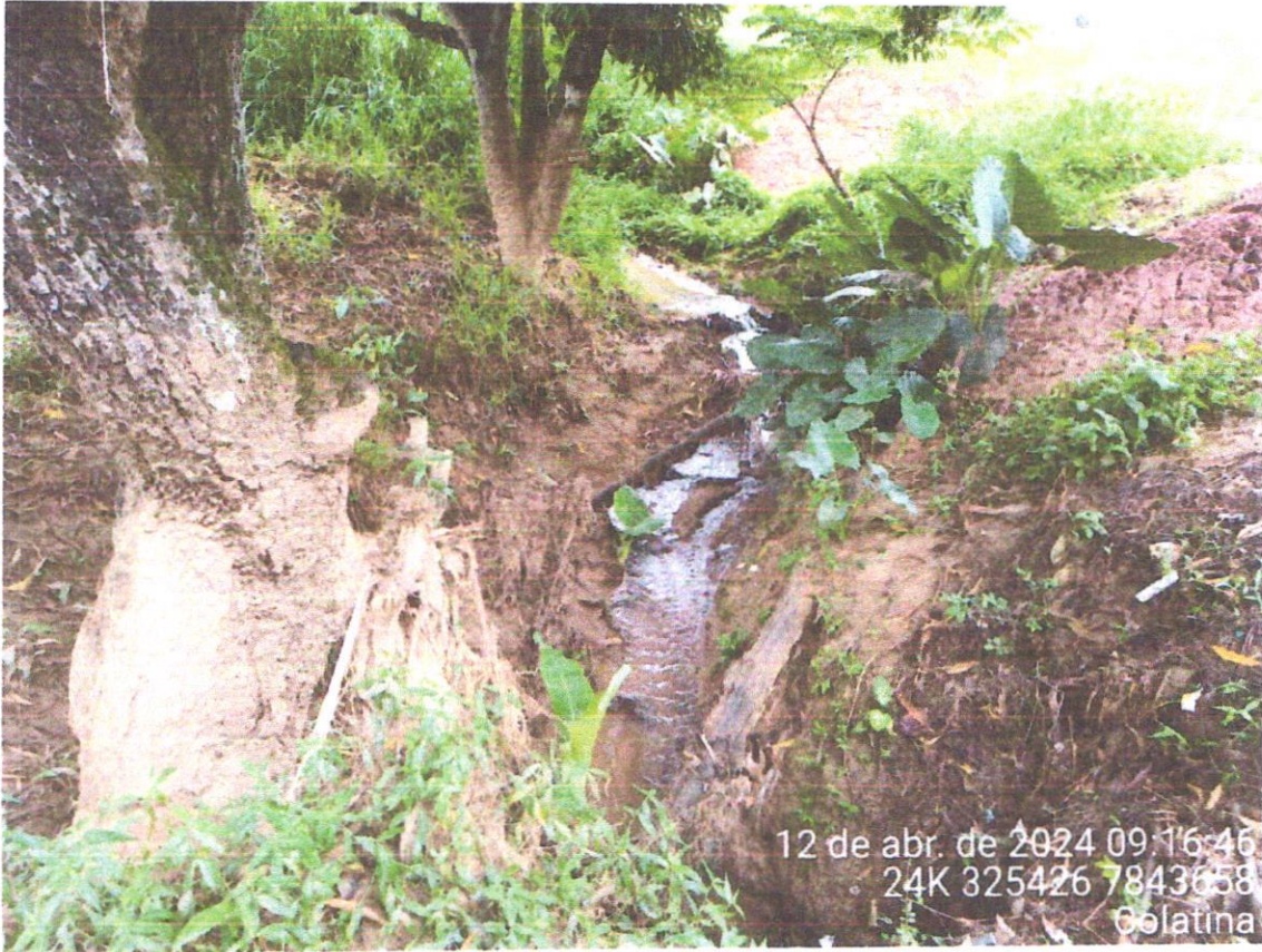
Córrego próximo a Rua Erondina.