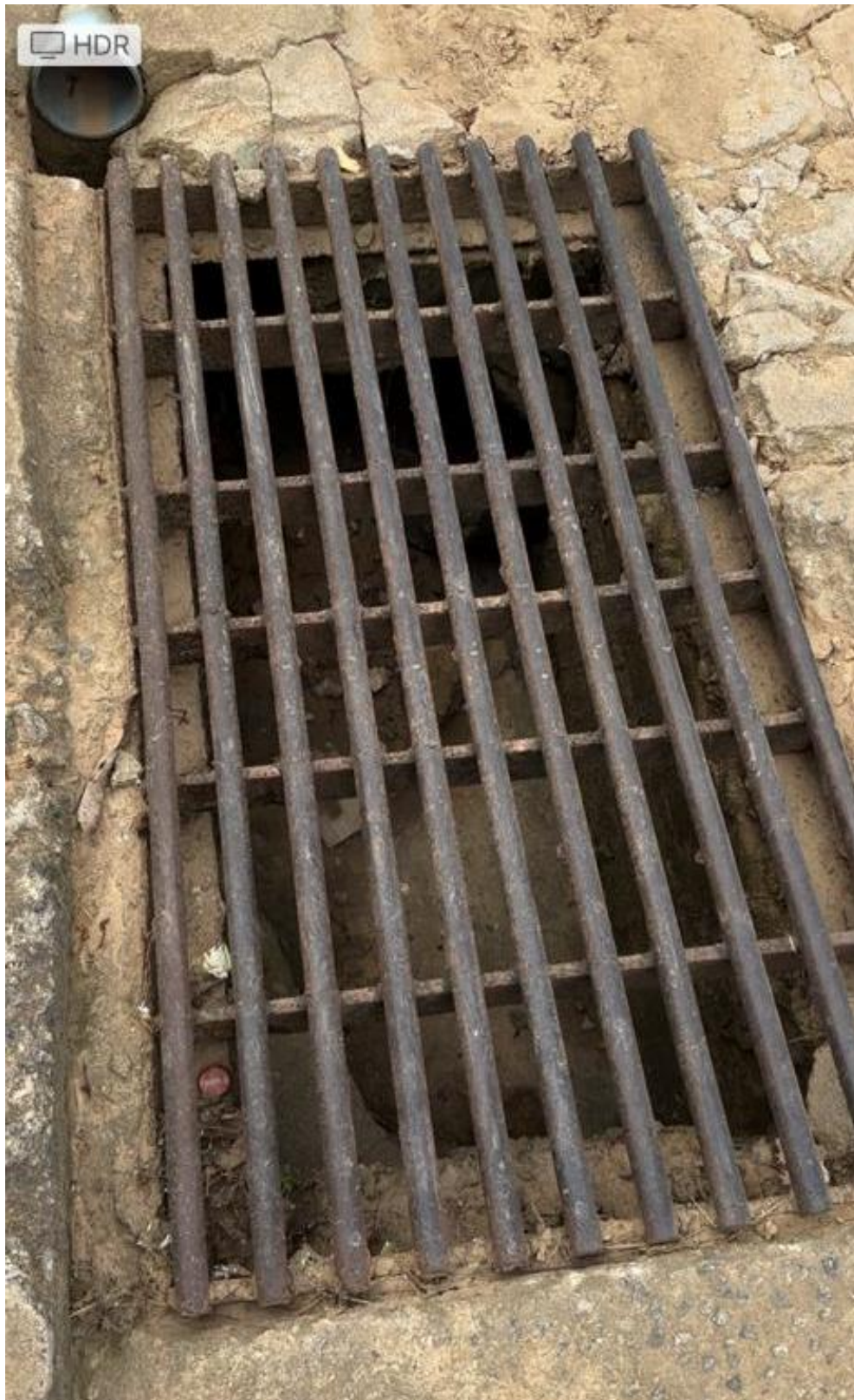
Legenda: Foto em 06/06/2023