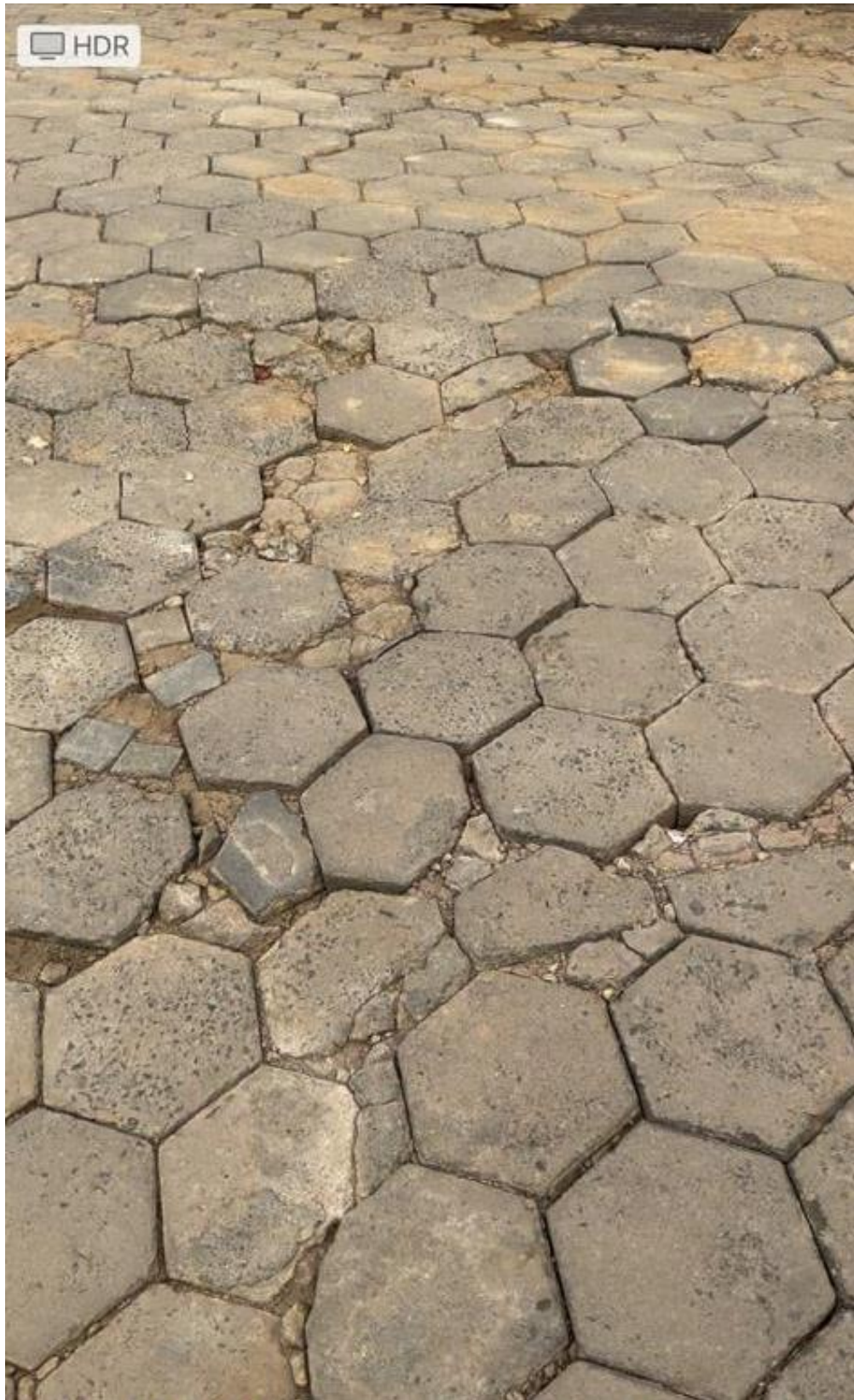
Legenda: Foto em 06/06/2023