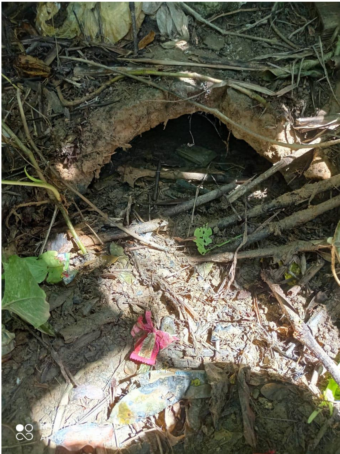
Legenda: manilha em 2021