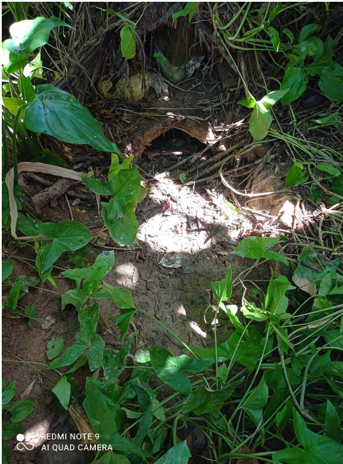
Legenda: manilha em 2021