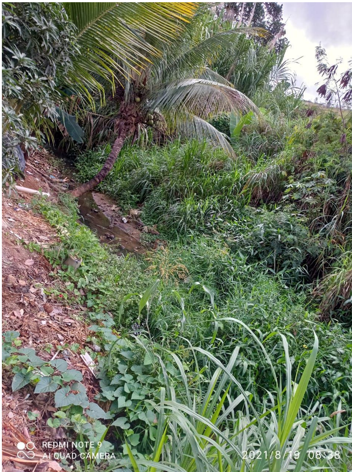
Legenda: Córrego em 2021