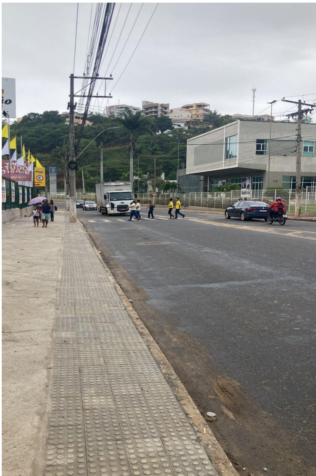
Legenda: Foto de 15 de dezembro de 2022