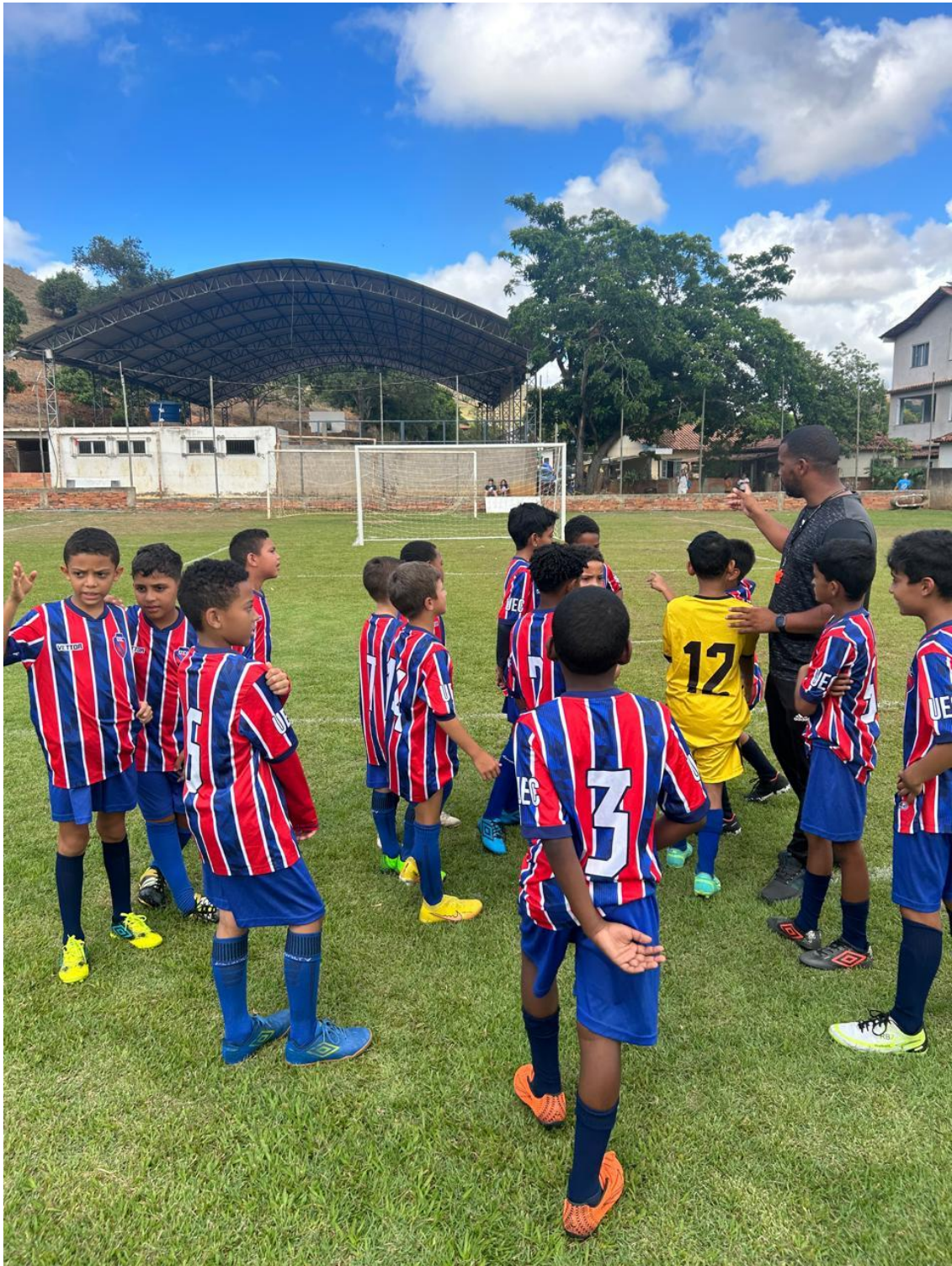
Foto: interação com outros projetos sociais, este foi vivenciado com a comunidade Boapaba, distrito de Colatina/ES.