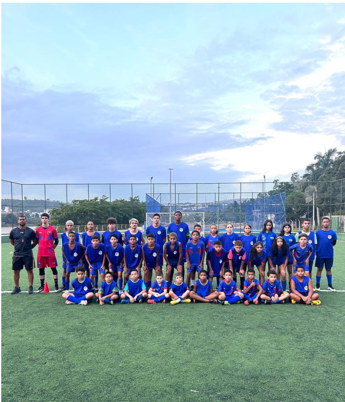
Foto: Treinamentos diários semanais.