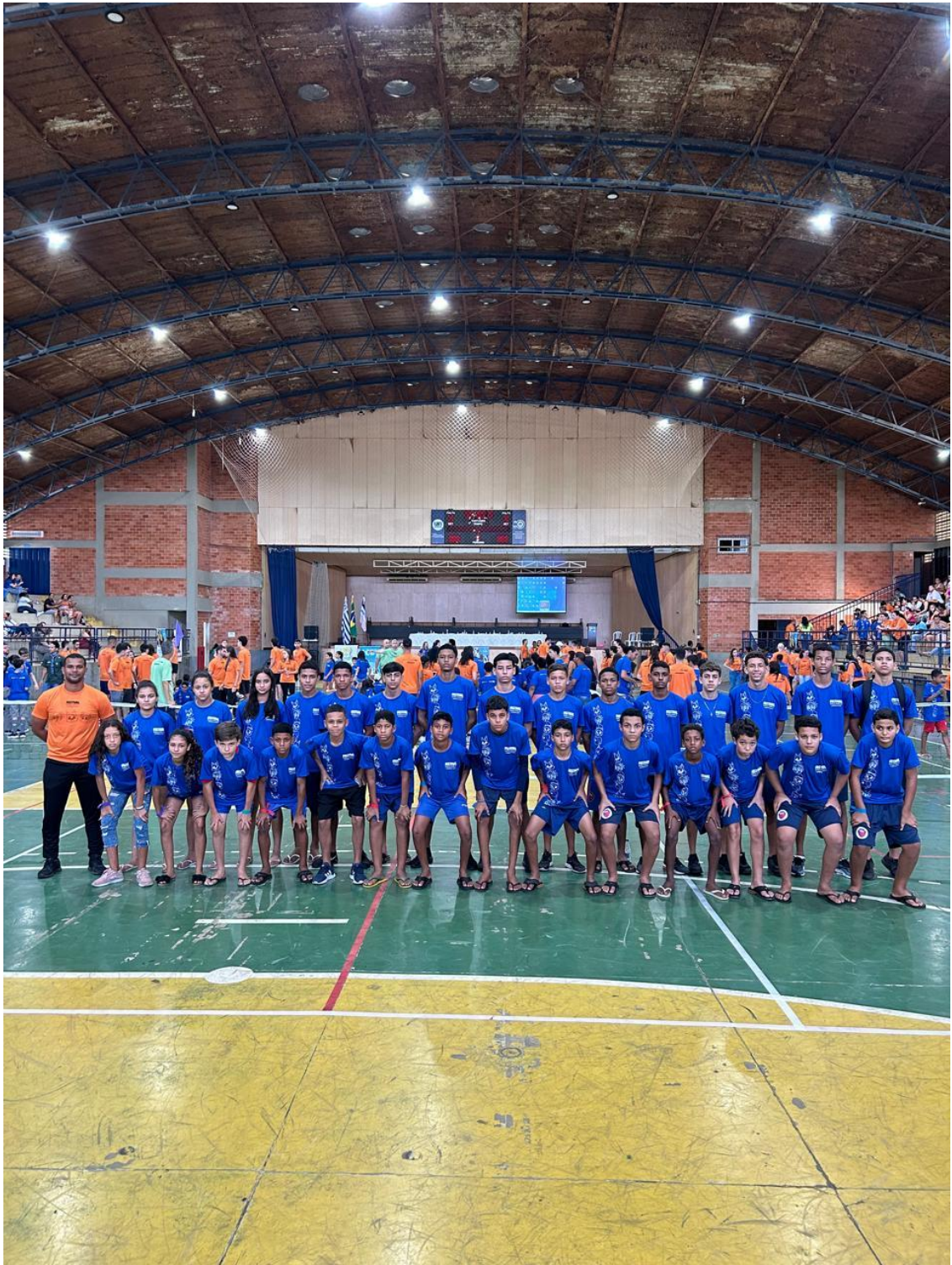
Foto: Nossa primeira participação no evento Paralímpico realizado na UNESC após o convite da ACDV de Colatina/ES.