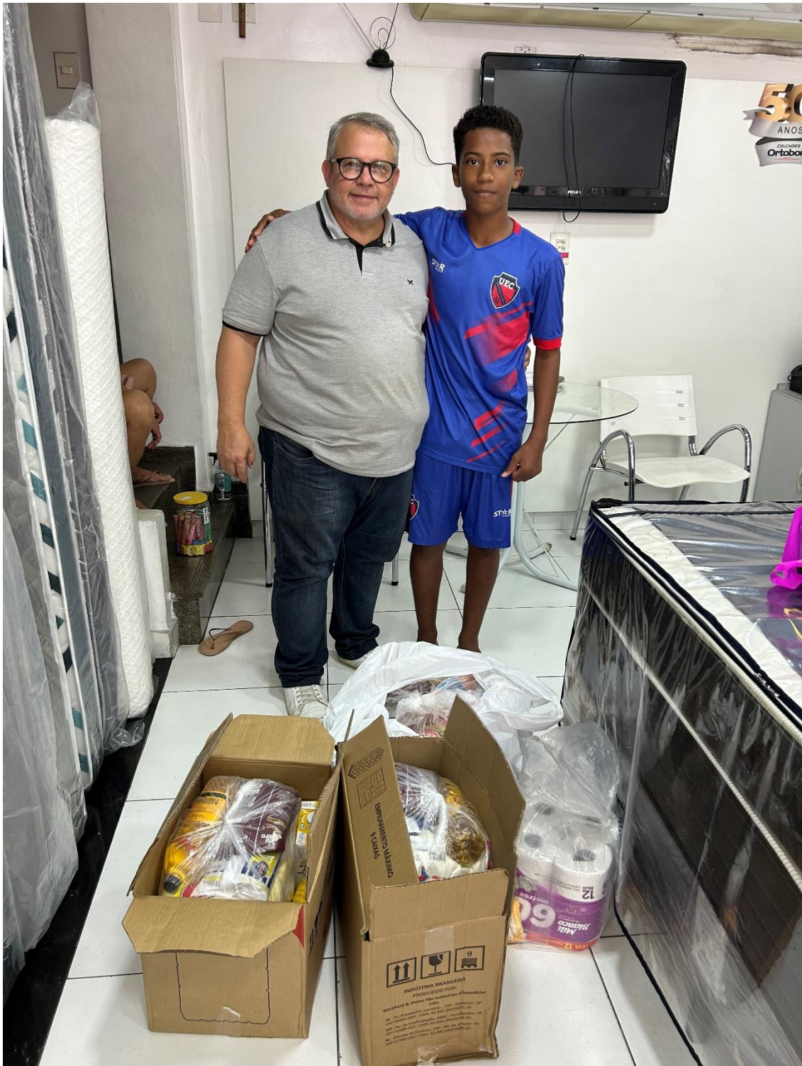
Foto: Cestas básicas para os atletas com necessidades alimentares.