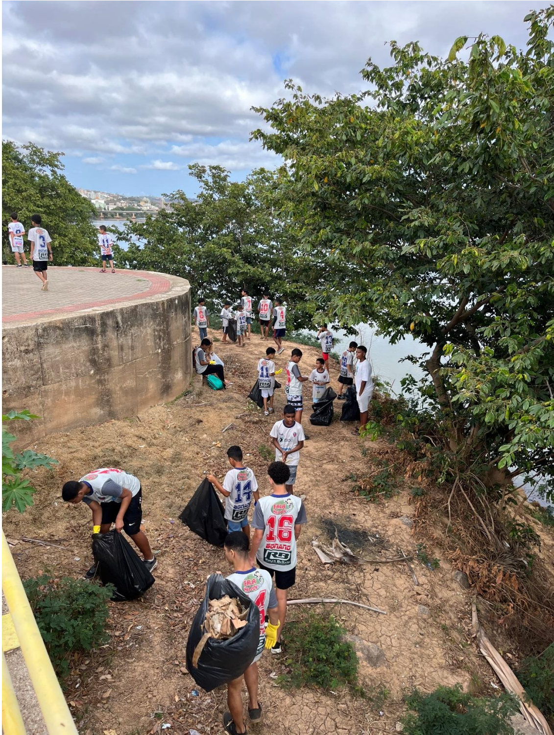
fotos: a nossa participação na limpeza das margens do Rio Doce.