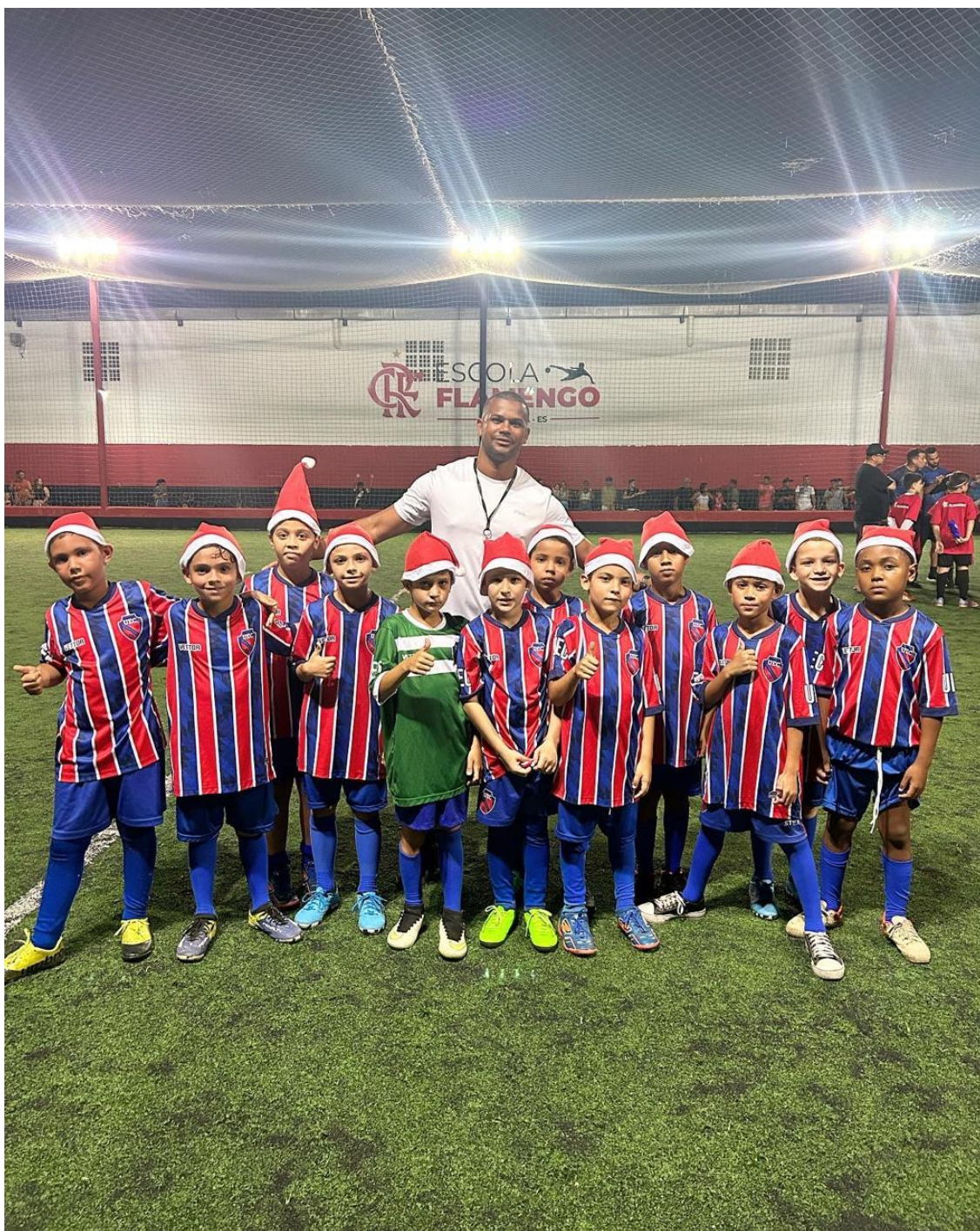
Foto: Amistoso com a recém chegada escolinha do Flamengo nas vésperas do Natal de 2023.