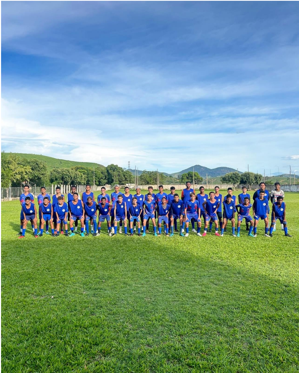
Foto: Treinamentos no campo do Peroba (todas as terças e quintas)