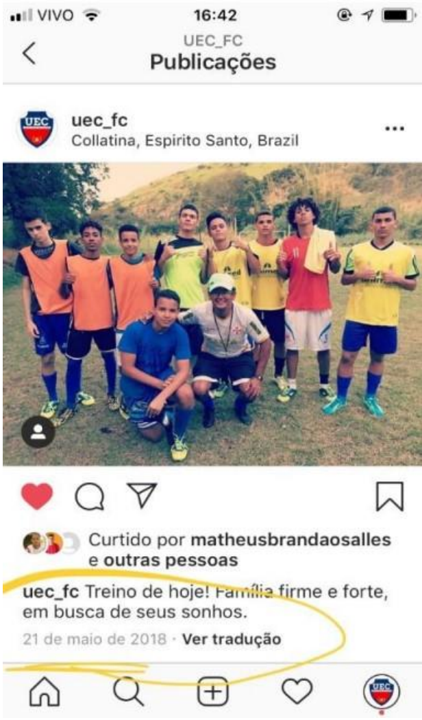
Foto: Registro de nossa primeira postagem em 21/08/2018.