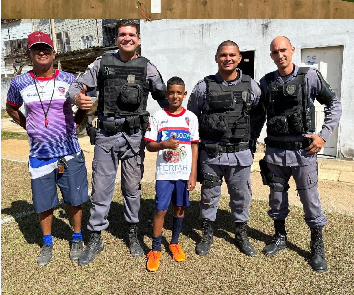
Fotos: A nossa participação junto a pastoral da Ecologia e o apoio da Polícia Militar.