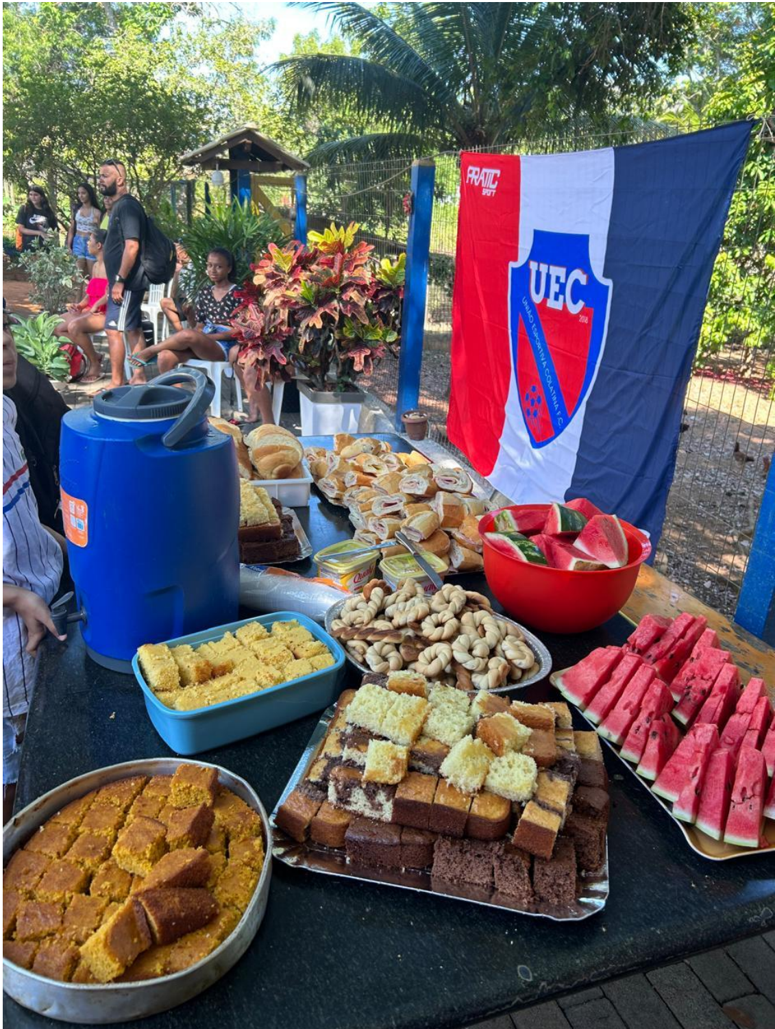
Foto: Confraternização de fim de ano.