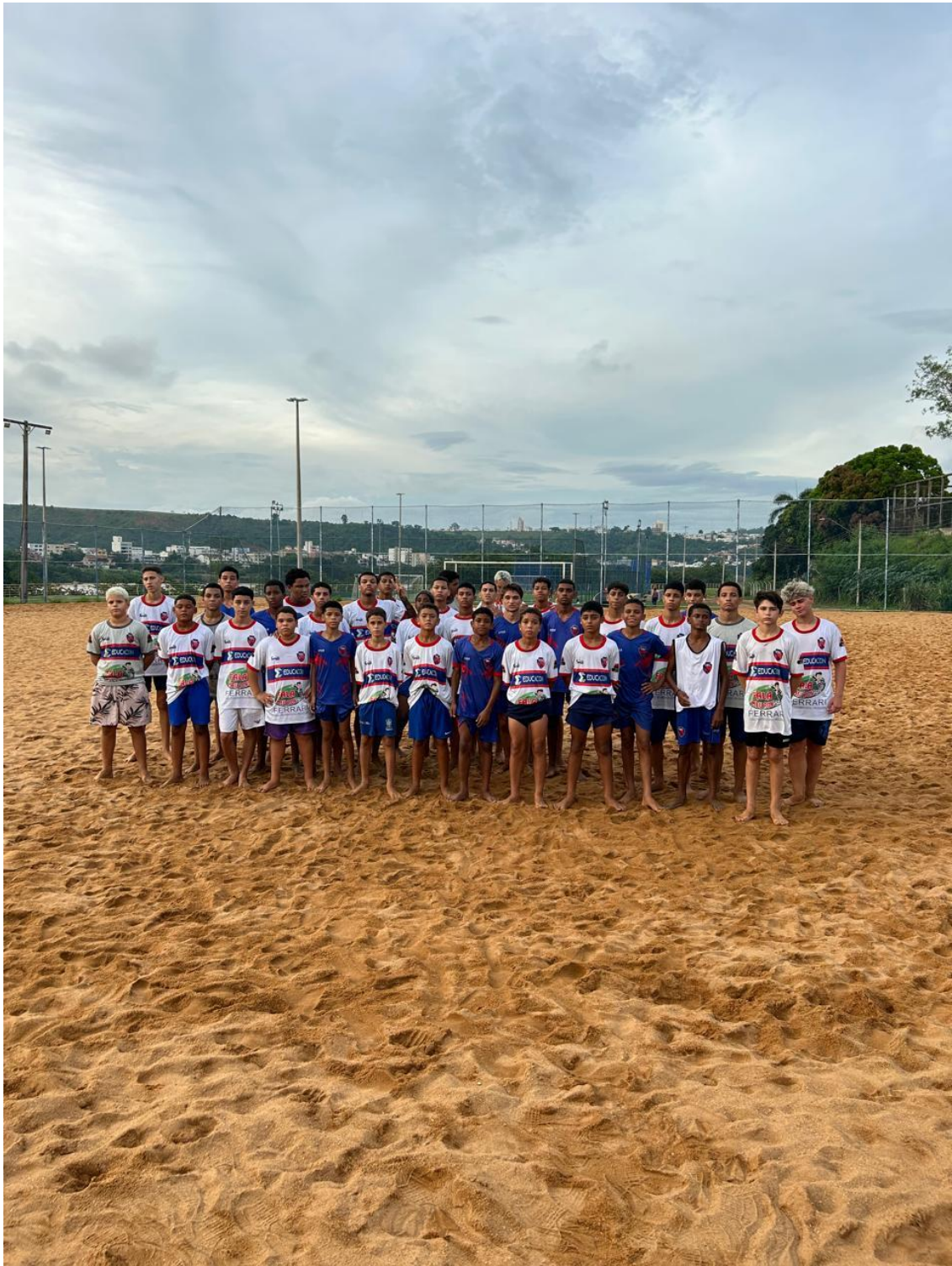
Foto: Treinamentos na areia.